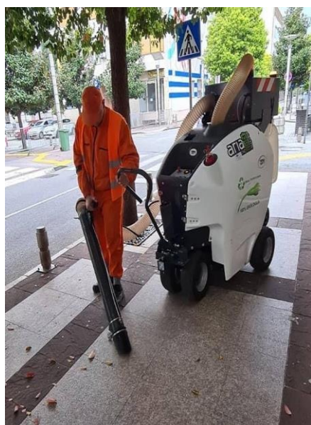
Slika 5. Mobilni usisivač