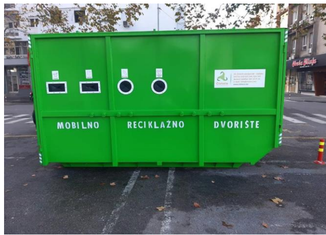
Slika 2. Mobilno reciklažno dvorište

S obzirom da su tokom ove, kao i prethodnih godina, već ostvareni određeni prihodi po osnovu plasmana sakupljenih količina neopasnih i opasnih otpada, a koji iz godine u godinu bilježe trend rasta, planirano je da se i tokom 2022. godine nastoji povećati nivo ovih prihoda, kako bi se u dogledno vrijeme stekli uslovi da ovi komunalni objekti budu djelimično ekonomski samoodrživi.