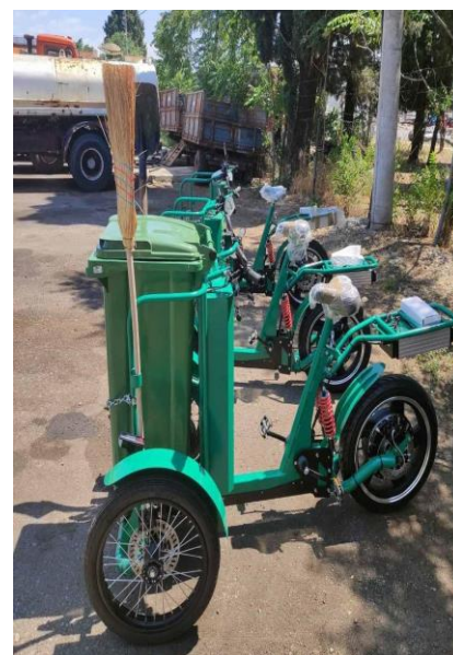
Slika 7. Električna trokolica