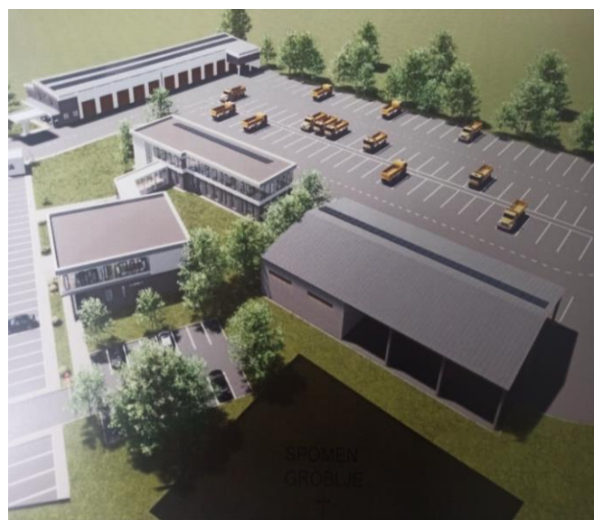
Slika 2. Idejno rješenje uprave zgrade sa pratećim objektima