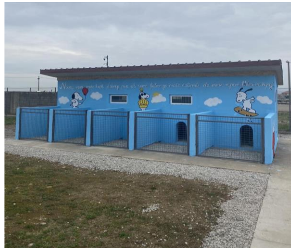
Slika 2. Pansion za pse