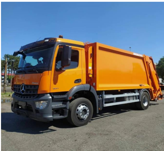
Slika 1. Autosmećar 16 m 3

Planirano širenje urbanih prostora i zahvatanje ruralnih područja za odlaganje i odvoz komunalnog otpada sa područja Glavnog grada, uz već postojeće obaveze, prirodom posla, zahtijeva dodatna sredstva i opremu, a što je uslov poboljšanja rada na sakupljanju i transportu komunalnog otpada, zaštite i očuvanja zdrave životne sredine.