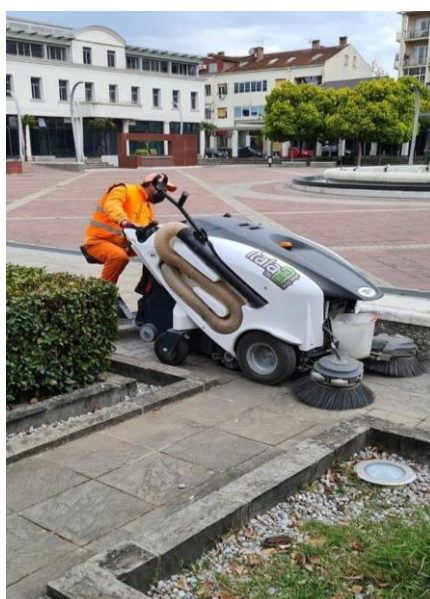
Slika 6. Elektročistilica