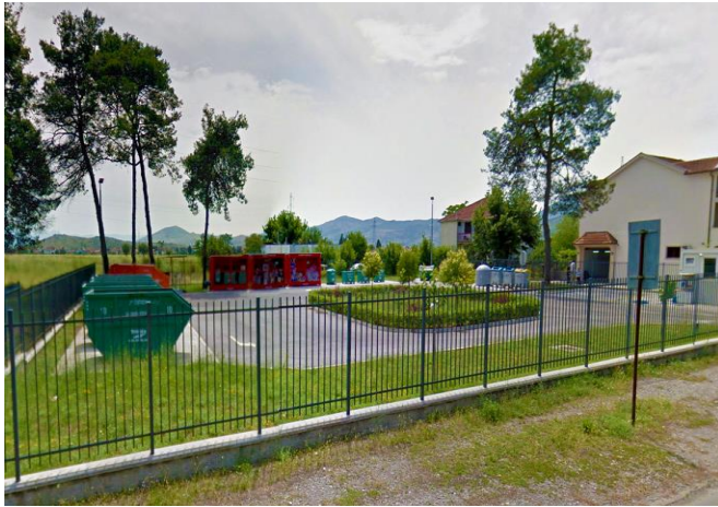
Slika 1. Reciklažno dvorište