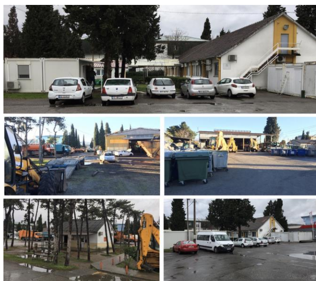
Slika 1. Postojeće stanje upravne zgrade sa pratećim objektima