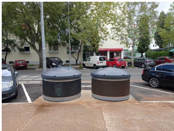
Slika 3. Polupodzemni kontejneri 5 m 3