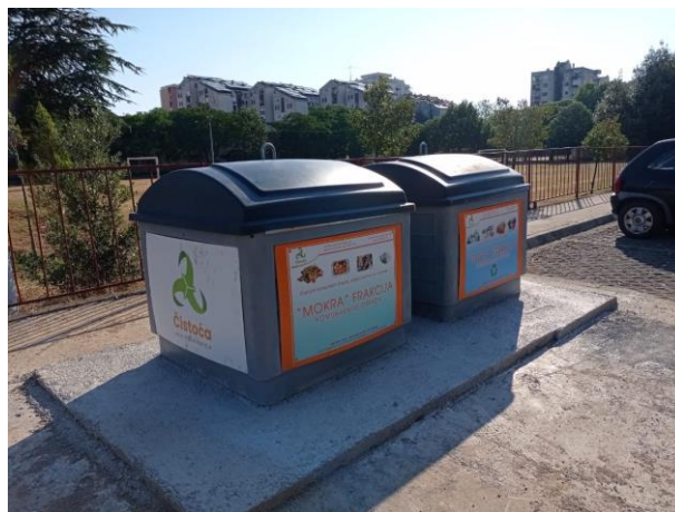
Slika 4. Polupodzemni kontejneri 2,5 m 3