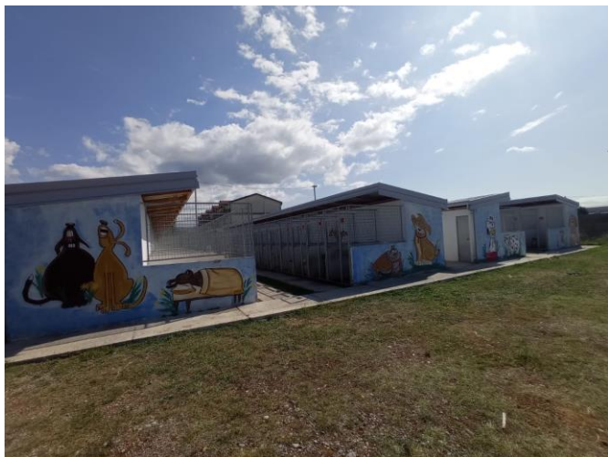
Slika 1. Boksovi za pse

Troškovi za obavljanje ovih poslova, koji uključuju zarade radnika i druga primanja, troškove električne energije, vode, goriva, nabavku hrane, održavanje objekata i drugo, u 2022. godini planirani su u iznosu od 112.500,00 eura.