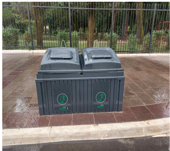
Slika 2. Polupodzemni kontejneri 6 m 3